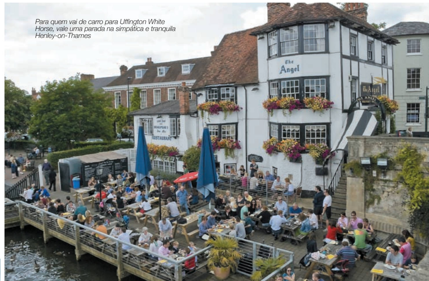
Para quem vai de carro para Uffington White Horse, vale uma parada na simpática e tranquila Henley-on-Thames

www.whitehorseshow.co.uk www.nationaltrust.org.uk www.mysteriousbritain.co.uk www.woolstonevillage.co.uk www.english-heritage.org.uk www.henleyonthames.org www.visitsouthoxfordshire.co.uk www.avebury-web.co.uk